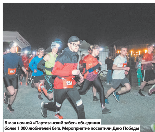
8 мая ночной «Партизанский забег» объединил более 1 000 любителей бега. Мероприятие посвятили Дню Победы