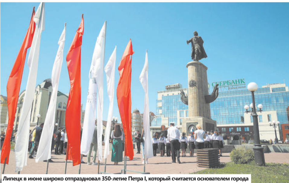
Липецк в июне широко отпраздновал 350-летие Петра I, который считается основателем города