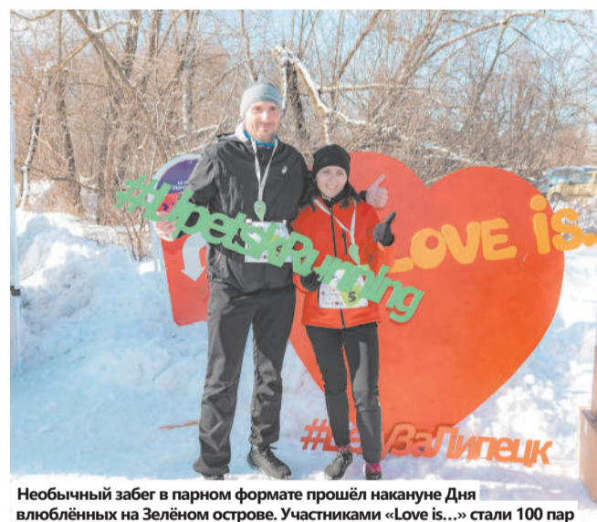
Необычный забег в парном формате прошёл накануне Дня влюблённых на Зелёном острове. Участниками «Love is...» стали 100 пар