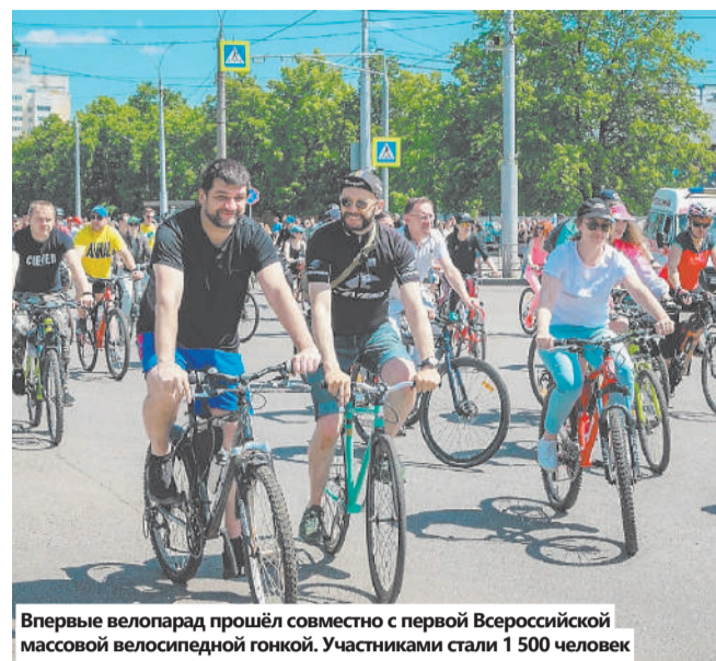
Впервые велопарад прошёл совместно с первой Всероссийской массовой велосипедной гонкой. Участниками стали 1 500 человек