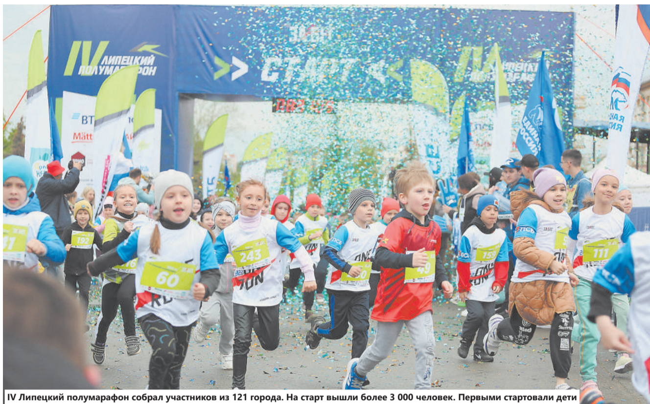
IV Липецкий полумарафон собрал участников из 121 города. На старт вышли более 3 000 человек. Первыми стартовали дети